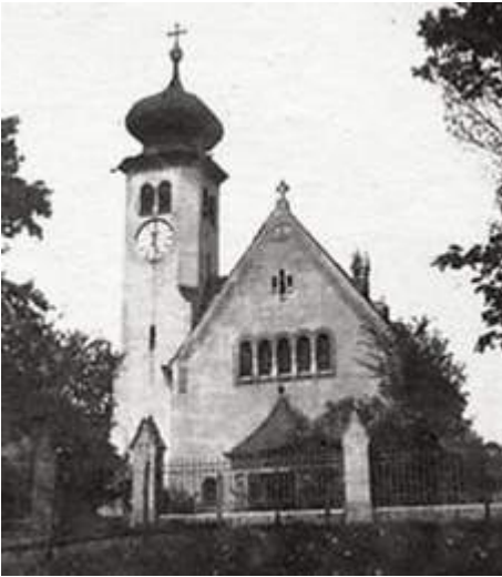
Unsere Kirche 1904