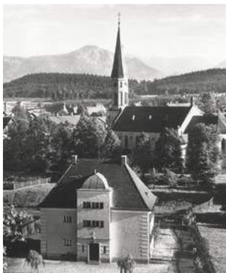
Das Pfarrhaus am Schloßfeldweg Dahinter die Barbarakirche