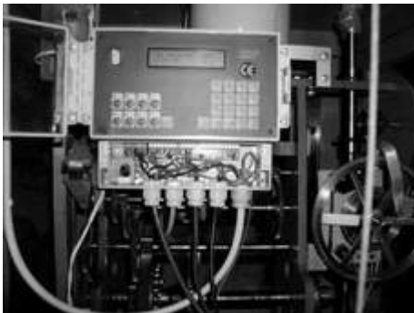
Die elektronische "Punto"-Uhr seit 13. Mai 1997

Schon vor dem Bau der Kirche wirkte Karl Goldner zum Wohle der Gemeinde in Penzberg (von 1855 - 1905). Am 4. Mai 1966 nahm man die Uhrenanlage in Betrieb. 1972 kam die elektrische Läuteanlage der Glocken hinzu.