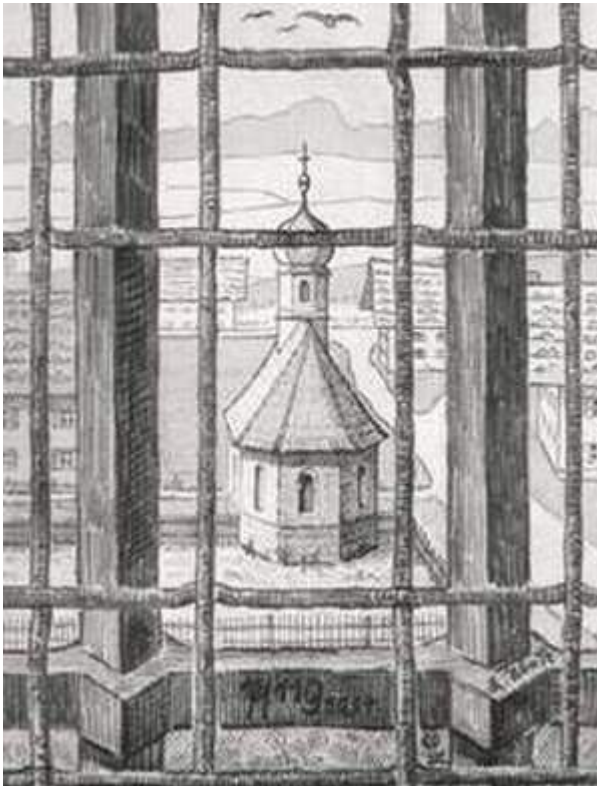
Blick aus der Zelle 20 des Weilheimer Gefängnisses; gezeichnet von Karl Steinbauer, von ihm unterschrieben mit den Worten: Aber Gottes Wort ist nicht gebunden! 2.Tim. 2,9