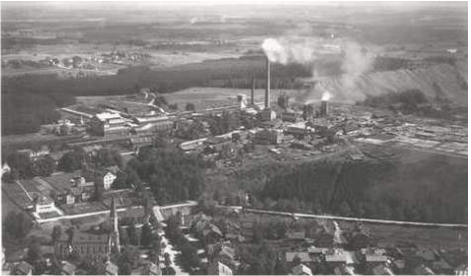
Penzberg im Jahre 1931. Im Vordergrund die alte kath. Pfarrkirche. Darüber links: Das evangelische Pfarrhaus. Am Bildrand links (angeschnitten) die evangelische Kirche

Das Kraftwerk in Penzberg war noch gebaut worden. Es sollte zum Teil die Existenz des Kohleabbaus in Penzberg sichern. Der erzeugte Strom wurde an die Bundesbahn geliefert. Aus seinem hohen Schornstein blies es die Abgase in die Luft, die mit ihren stickigen Wolken über die Stadt dahinzogen. Trotz des erbauten Kraftwerks wurde immer wieder gemunkelt - und schließlich schlug die Nachricht wie ein Blitz in der Stadt Penzberg ein: Das Bergwerk wird geschlossen! Das Bergwerk war der Hauptarbeitgeber in der Stadt!