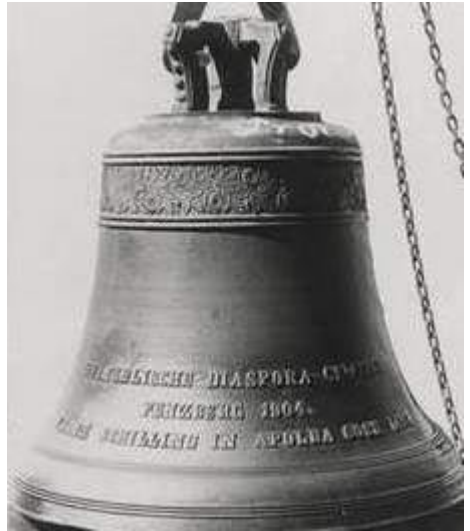
Eine der Glocken der Firma Schilling in Apolda