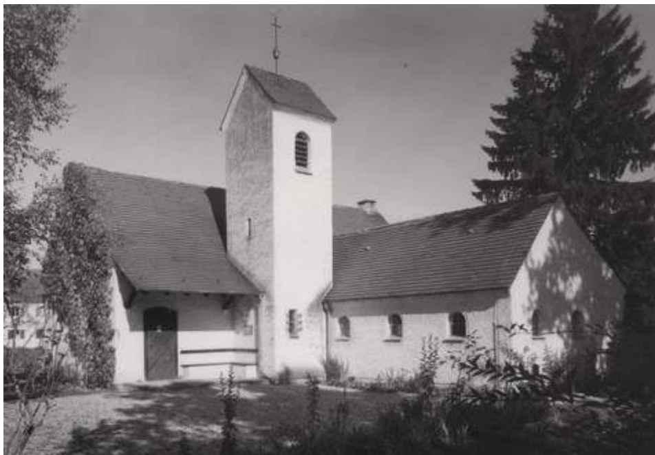
Die evangelische Kirche in Seeshaupt

100 Jahre Evangelische Kirche Penzberg - da kann die kleine Schwester aus Seeshaupt nicht mithalten. Aber immerhin gibt es in Seeshaupt schon seit 1926 eine evangelische Gemeinde, wie die Gravur auf dem silbernen Abendmahlskelch beweist. Die Gottesdienste wurden in der Schule abgehalten, bis die kleine Kirche an der Seeseitener Straße 1935 eingeweiht wurde; die Predigt hielt Vikar Steinbauer. Damals ahnte freilich noch niemand, dass die kleine Schar der protestantischen Seeshaupter schon bald rasant anwachsen würde: